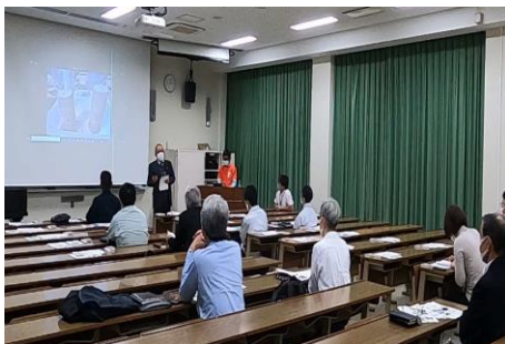
当社の取り組みについて の講義

課題は多く更なる挑戦が必要ですが、当社はこれからも海洋プラスチックごみ回収にむけて技術開発に取り組んでいきます。